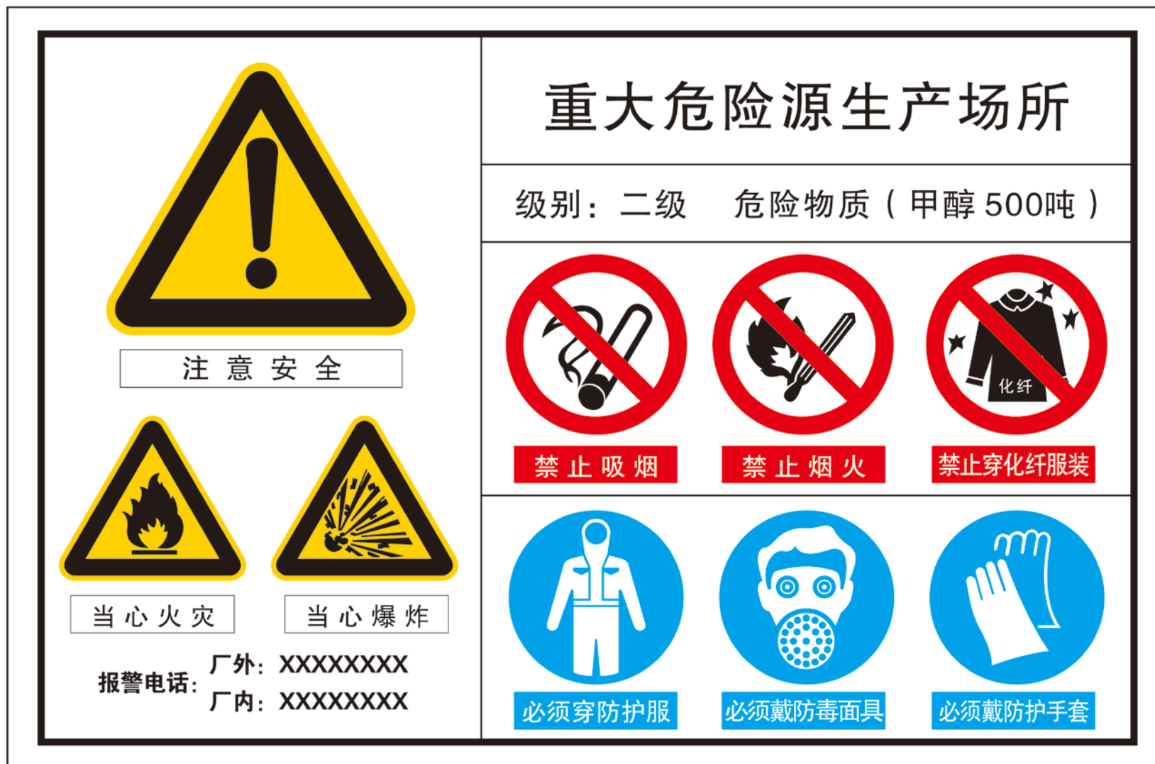
样例 2：重大危险源安全警示牌示例